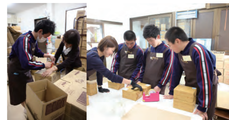
地元中学校からの実習体験