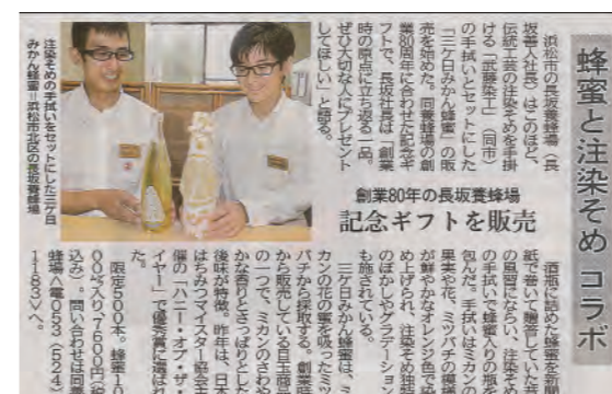
「新蜜の三ヶ日みかん蜂蜜と浜松注染そめ手ぬぐいギフト」が静岡新聞に掲載されました

昭和 36 年創業。創業当時は 100 社ほどあった注染工場も、今では武藤染工さんを含め 6 社のみ。今もなお、注染そめを作り続け、遠州地域の織物染色加工の振興に尽力されています。