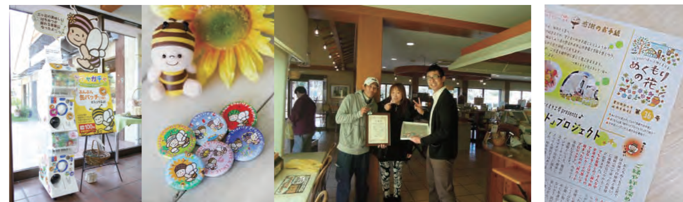
季節ごとに、その季節に合った絵柄のバッジを展開し、お客様が楽しく継続的に関わられる工夫をしています。また、全種類のバッジを集めてチャリティーに多大な貢献をして下さったお客様には表彰状を送呈いたしました。