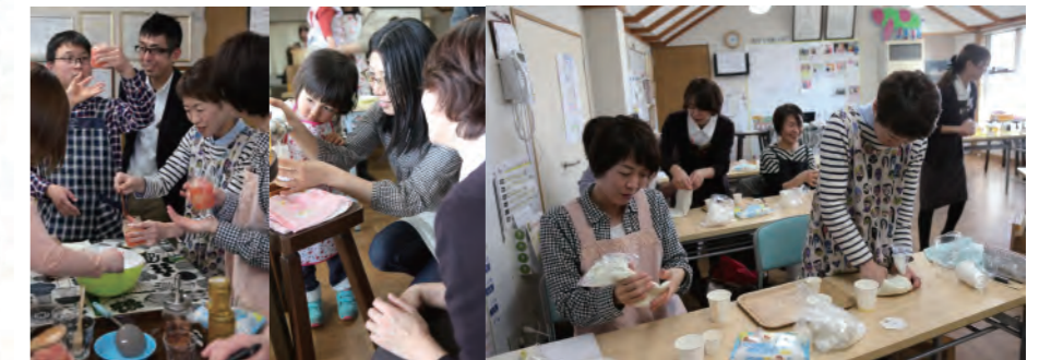
はちみつソムリエ教室の様子が中日新聞に掲載されました