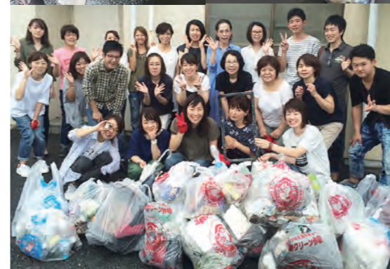
奥浜名湖周辺の地域清掃では、毎回たくさんのゴミが集まります