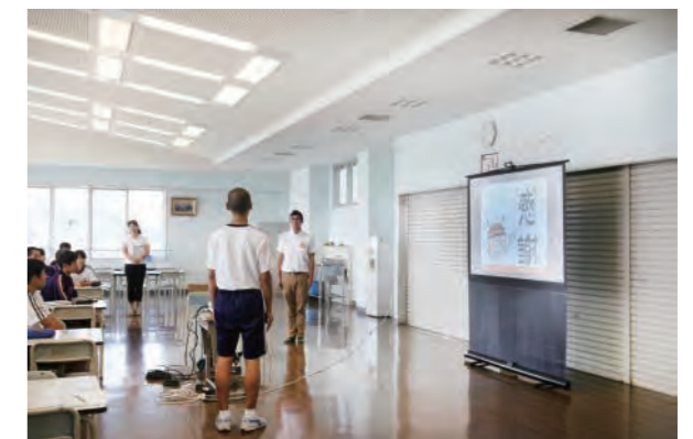
地元中学校での講演