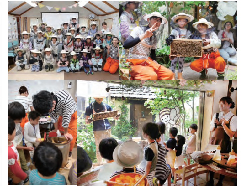
採蜜体験教室の様子が静岡新聞に掲載されました