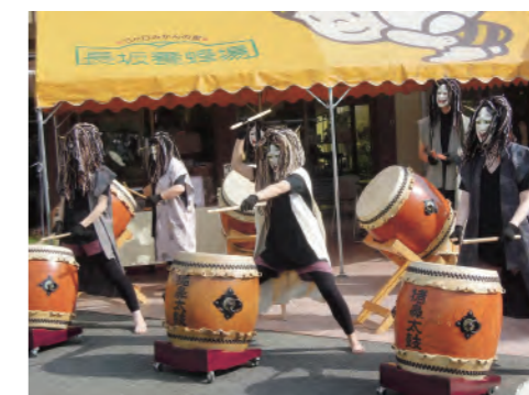
三ヶ日地域の伝統文化「猪鼻鬼面太鼓」をスタッフが練習を重ね、地域のイベントで披露