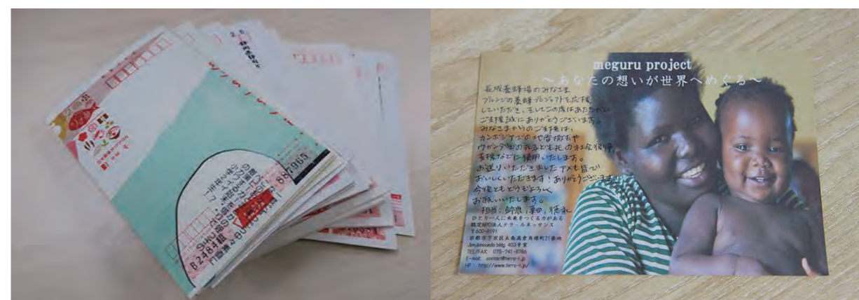
社内で書き損じハガキを回収。NPO法人テラ・ルネッサンス様よりお礼状をいただきました