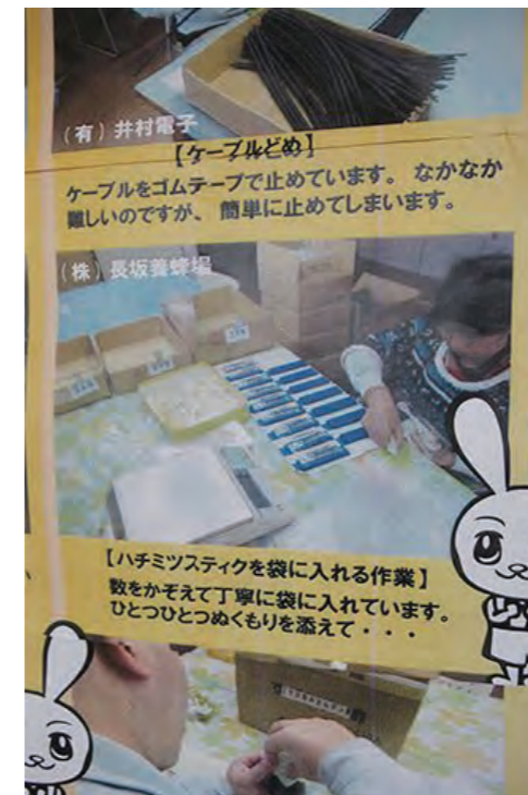
はちみつスティックを袋入れする様子

🔥仕事を発注するだけでなく、よりパートナーへの理解を深めたいというスタッフの声から、三ヶ日たちばな授産所の施設長を社内にお招きし、社内講演も実現しました。施設のことや利用者さんのこと、障がいのことなど、さらに理解を深めることで愛着が一層高まり、よりよい関係作りに発展しています。