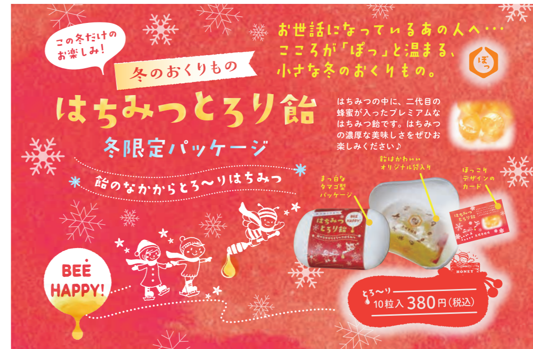
スタッフ全員でアイデアを出し合い、施設で在庫過剰になった資材を有効活用した商品開発