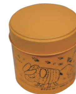
三ヶ日たちばな授産所様の利用者さんが描いた可愛い絵の缶に、はちみつ飴をつけて「BEE HAPPY 缶」として販売