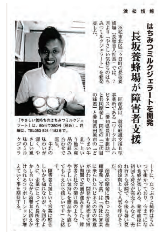
「やさしい気持ちのはちみつミルクジェラート」が浜松情報に掲載されました