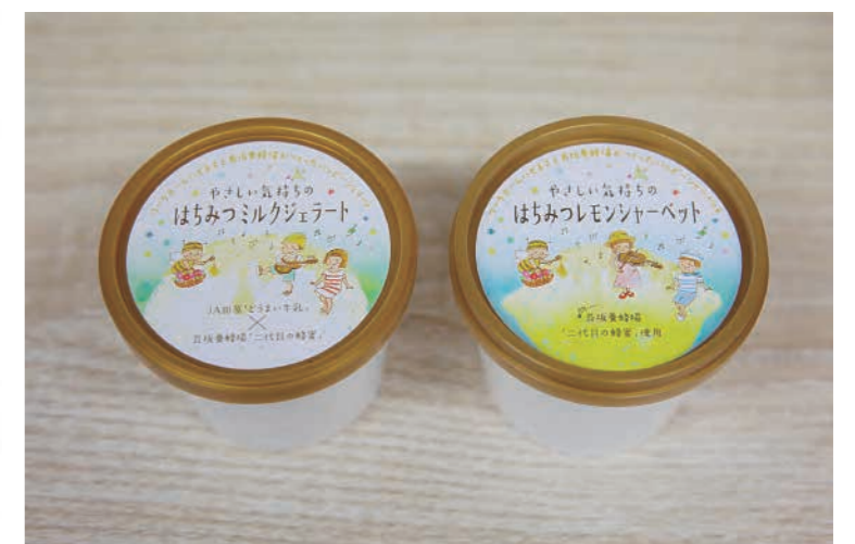
現在はコラボ第 2 弾「やさしい気持ちのはちみつレモンシャーベット」も展開中