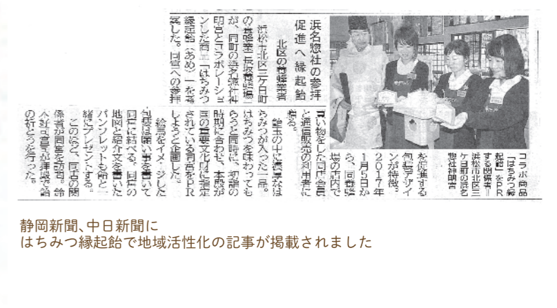
静岡新聞、中日新聞にはちみつ縁起飴で地域活性化の記事が掲載されました