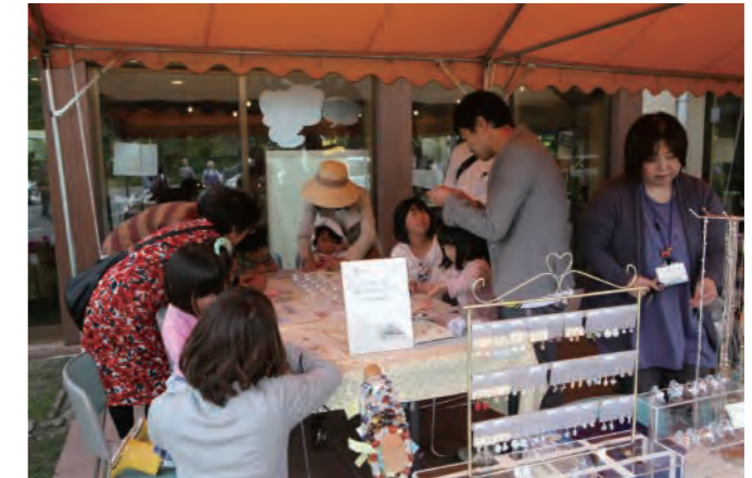
もくせい会様との共同イベント