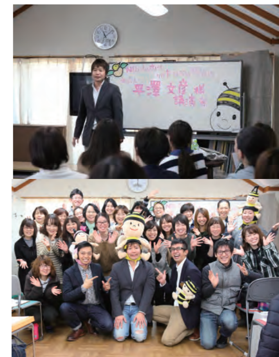
三ヶ日たちばな授産所施設長を招いての社内講演会