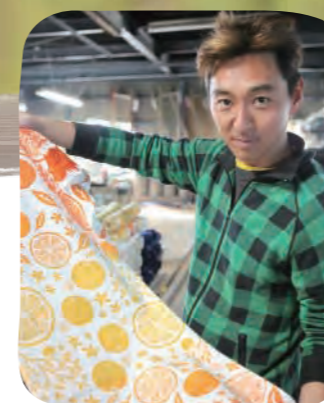
手ぬぐい製作先／武藤染工株式会社 様

昭和 36 年創業。創業当時は 100 社ほどあった注染工場も、今では武藤染工さんを含め 6 社のみ。今もなお、注染そめを作り続け、遠州地域の織物染色加工の振興に尽力されています。