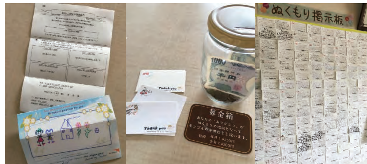
チャイルドスポンサーとありがとうカードを組み合わせることで、社内に感謝の念が深まりました