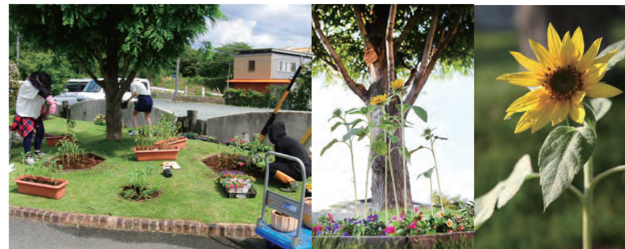
毎年、夏になるとスタッフで店舗の庭に福島のひまわりの種を植え、ひまわりを育てています。お客様には咲き誇るひまわりを楽しんでいただきながら、このプロジェクトについても知っていただく取り組みを続けています。

震災から6年が経ちましたが、これからも自分たちにできることをスタッフ一人一人、日々地道に尽くしていきます。また、プロジェクトに賛同いただけるお客様とも協力しながら、スタッフだけでなくお客様とも手を携え、想いを一つにして支援を続けていきたいと思っております。