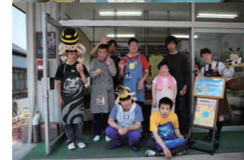
三ヶ日たちばな授産所様にて ・特製かき氷の出張プレゼント ・イベント時には積極的にスタッフが参加