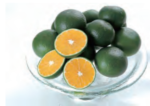
三ヶ日みかん農家さんが、この時期みかんの木から間引いてしまう「摘果みかん」を有効活用した「三ヶ日みかん青搾りジュース」