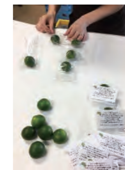
遠く離れたお客様にも摘果みかんのことを知ってもらえるよう、通販をご利用のお客様の同梱物としても入れさせていただいています