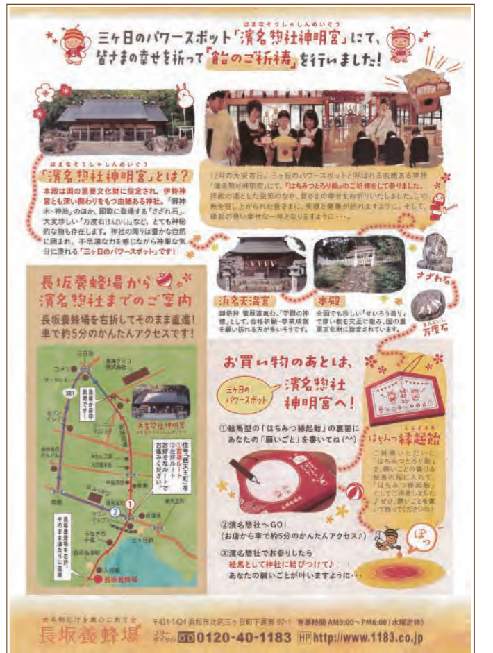
商品と合わせて、神社の紹介と行き方をお客様には配布し、参拝を促しました（昨年：初生衣神社様、今年：浜名惣社神明宮様）