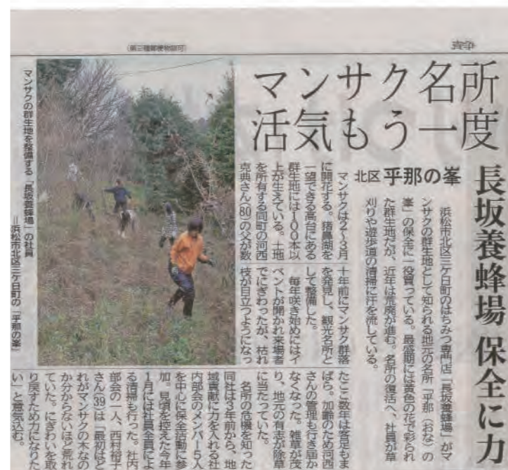
マンサク山保全活動の様子が静岡新聞に掲載されました