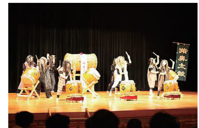
NPO法人すだち様設立10周年記念イベントで猪鼻鬼面太鼓を披露