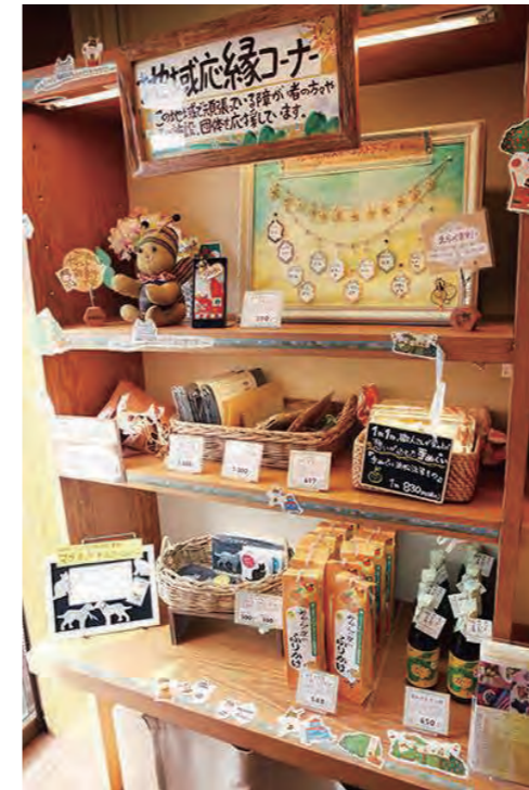
地域応「縁」コーナー

・通販をご利用のお客様や会員様に定期的にお届けしているDM(パンフ・カタログ)があります。ウイズ半田様に取材訪問し、DMにて記事として【ウイズ半田のこと、商品のこと、視覚障がいのこと】など商品の背景にある想いをまとめ、視覚障がいのことについて広く知ってもらうための発信を行いました。また、記事を店内でも配布・設置し、商品の背景にある障がいのある方への理解を深めていただくよう努めています。