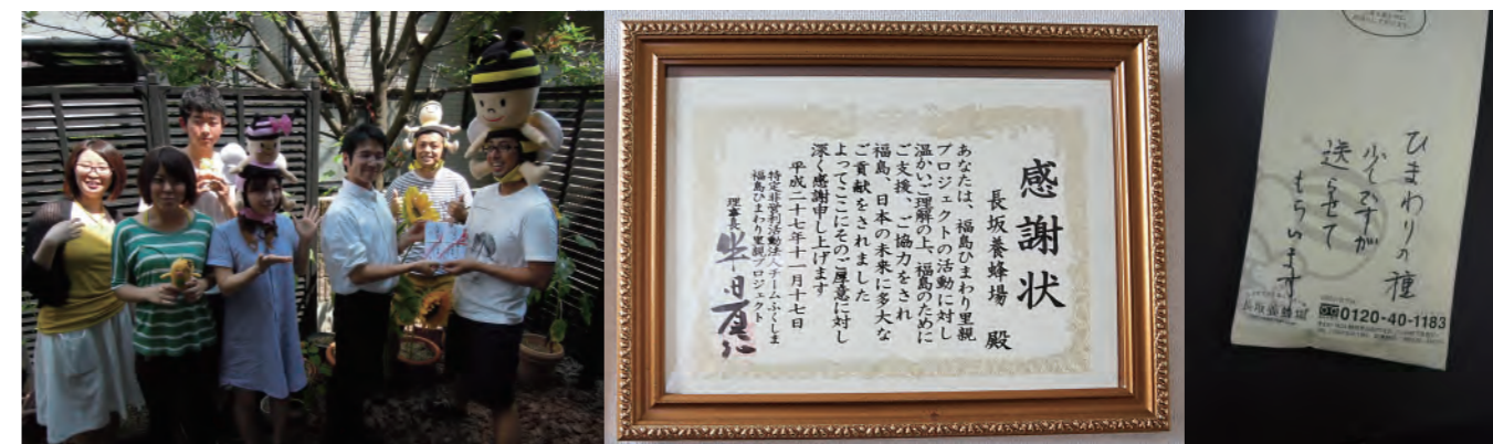
実際に現地に訪れ、支援金をお渡しするとともに現地の様子を体験し、お客様に継続的に発信してまいりました。また、このプロジェクトにご協力くださり、種をお送りくださるお客様もいらっしゃいます。