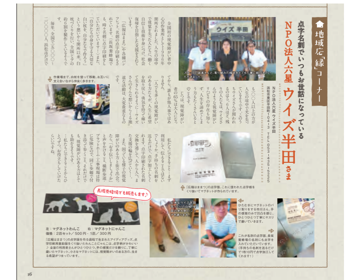
ウイズ半田様を取材、DMにて特集記事掲載