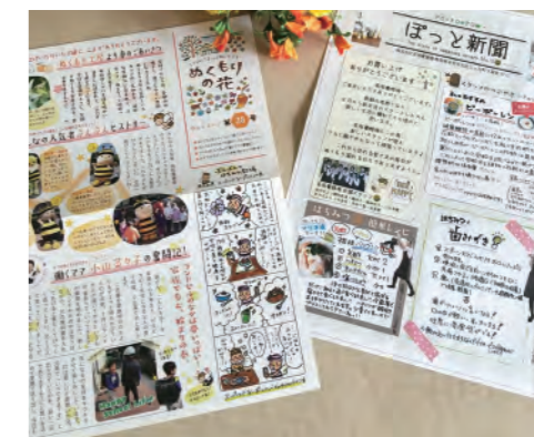
「ぼっと新聞」と「ぬくもりの花」。地域のおすすめスポットや情報をお客様に伝え、地域のお店への来店を促しています